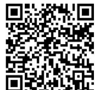
堺市ホームページ [堺市職員採用案内]

TEL 072-228-7449 (直通) FAX 072-228-7141 e-mail jini@city.sakai.lg.jp