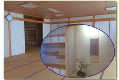
■和室 (茶室付) 定員40人