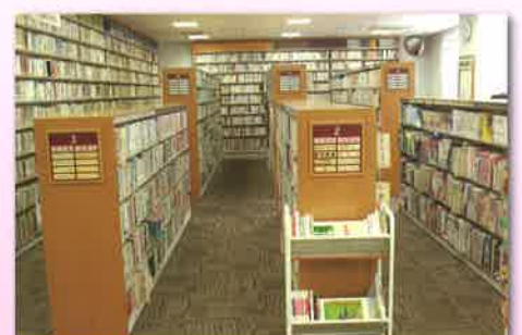
■人権資料・図書室