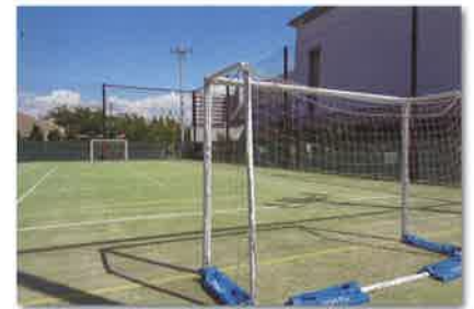
■フットサルコート兼 テニスコート