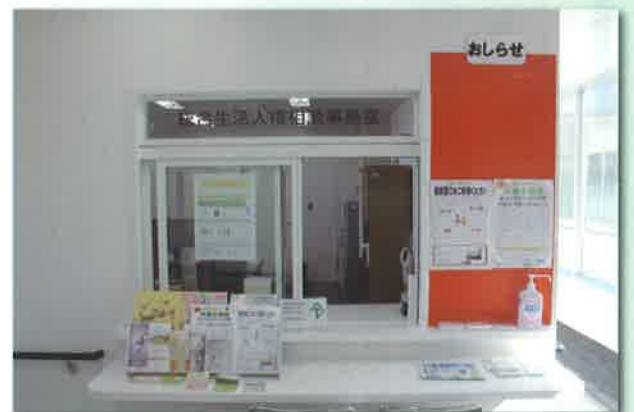
■総合生活・人権相談事務室