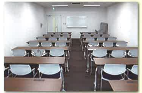
■学習室 1・2・3 各定員45人