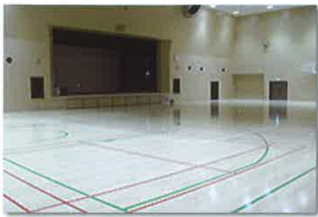
■メインホール (体育館の仕様)