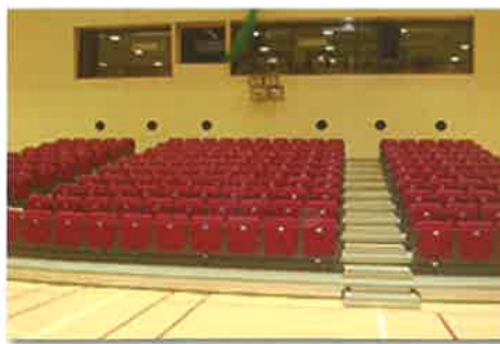
■メインホール (舞台ホール仕様) 定員300人