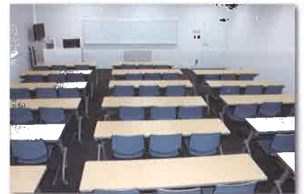
■ガイダンスルーム兼 視聴覚室 定員 54人