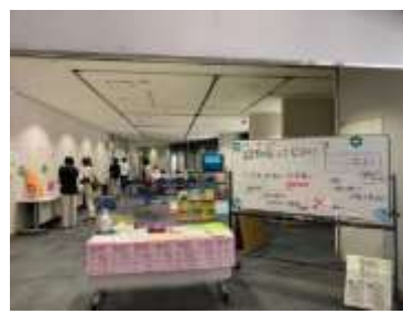
「認知症ってなあに？」の様子