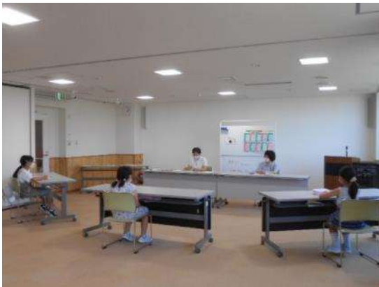
昔話勉強会とこども司書の交流