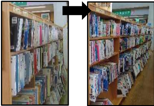
(本数を増やし、ゆとりの生じた児童書架)