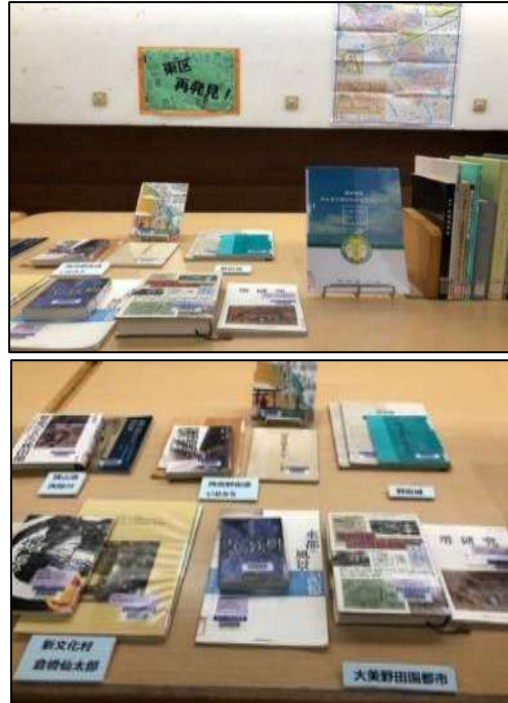
※写真は12月実施分 1月は特設コーナーで実施