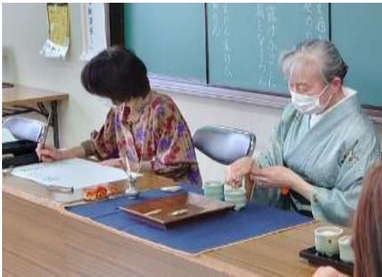
堺歴史文化市民講座の様子