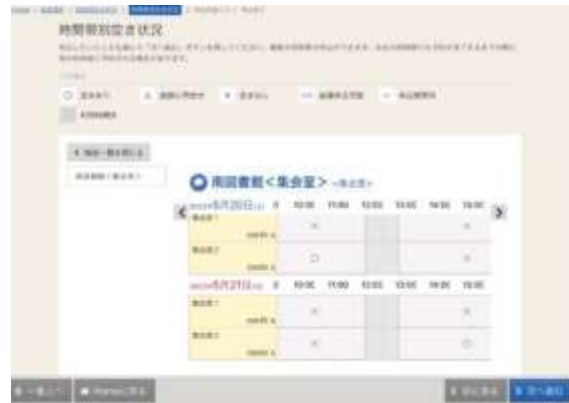
施設予約システム空き状況確認画面