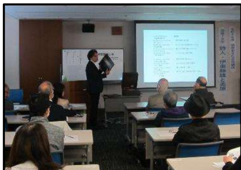
(講演会「没後 70 年 詩人・伊東静雄と美原」)