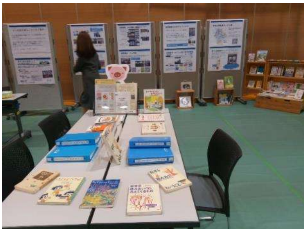
医療情報パネル展示