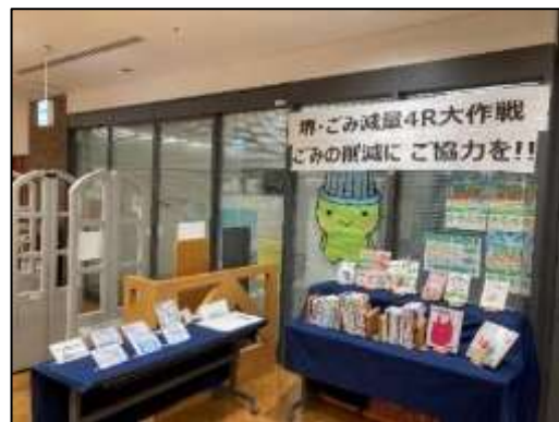
▲環境施設課との連携ブックフェア