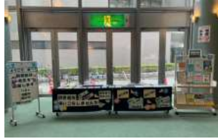
教職員研修での出張展示風景