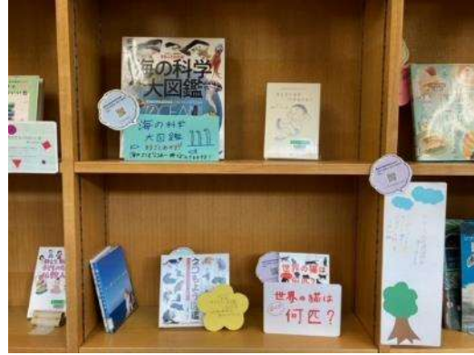
ティーンズコーナー 大阪商業大学堺高等学校の生徒が構成した書架