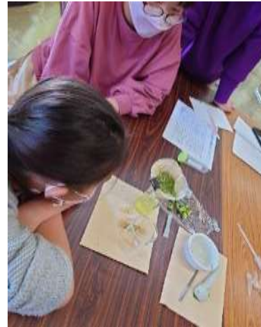
おたのしみフェア体験講座の様子