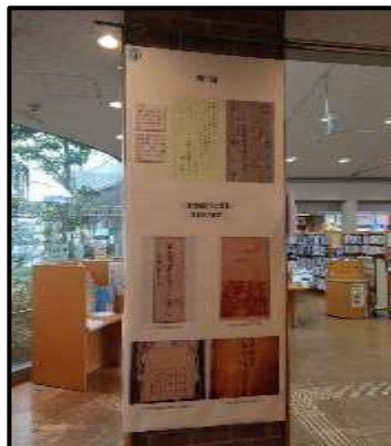
(「手紙にみる伊東静雄」パネル展示)