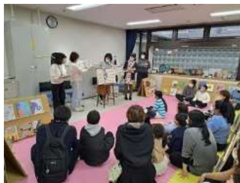
「いろいろなことばのえほんのひろば」会場の様子