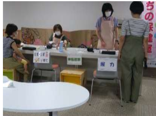
まちの保健室の健康子育て相談事業