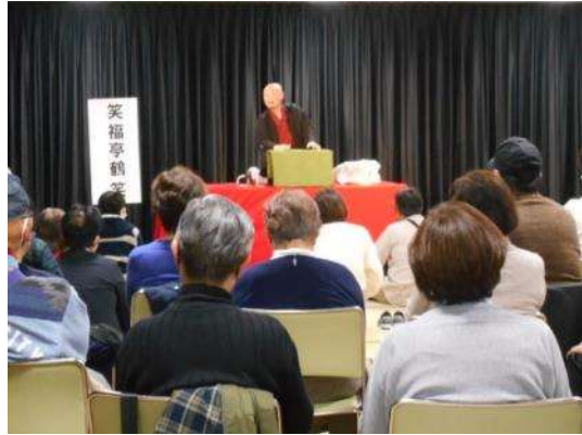
ボランティア主体の人形劇と落語の会