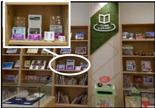
(ららぽーと堺の図書館情報コーナー)

1. あらゆる機会を捉えて地域の図書館の存在をアピールし、新規利用者を増加させる