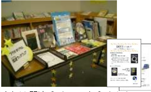
プラネタリウム関連ブックフェアとブックリスト