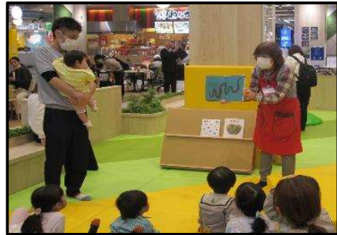
(ららぽーと堺での読み聞かせ会)