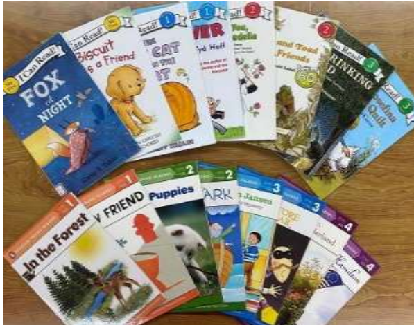
英語多読資料の一部