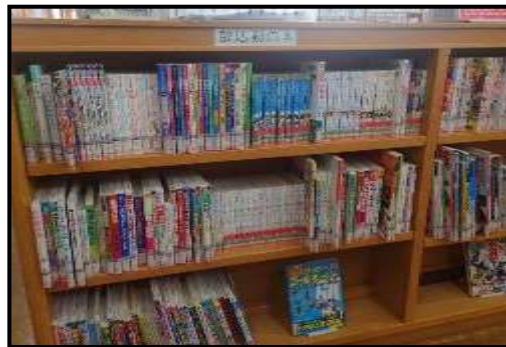
(ティーンズエリア部活動コーナー)