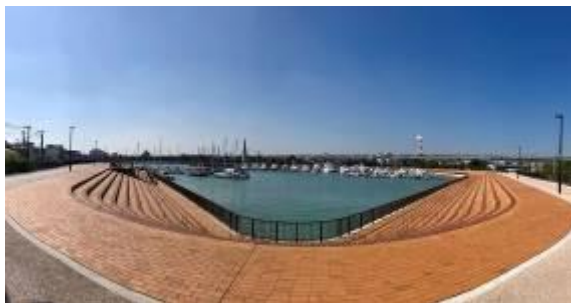
堺 旧 港

堺区は市域の北西部に位置し、北は大和川を隔てて大阪市と接し、西は大阪湾に臨んでいます。