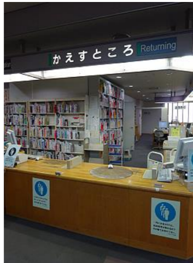
図書サービスコーナーのイメージ