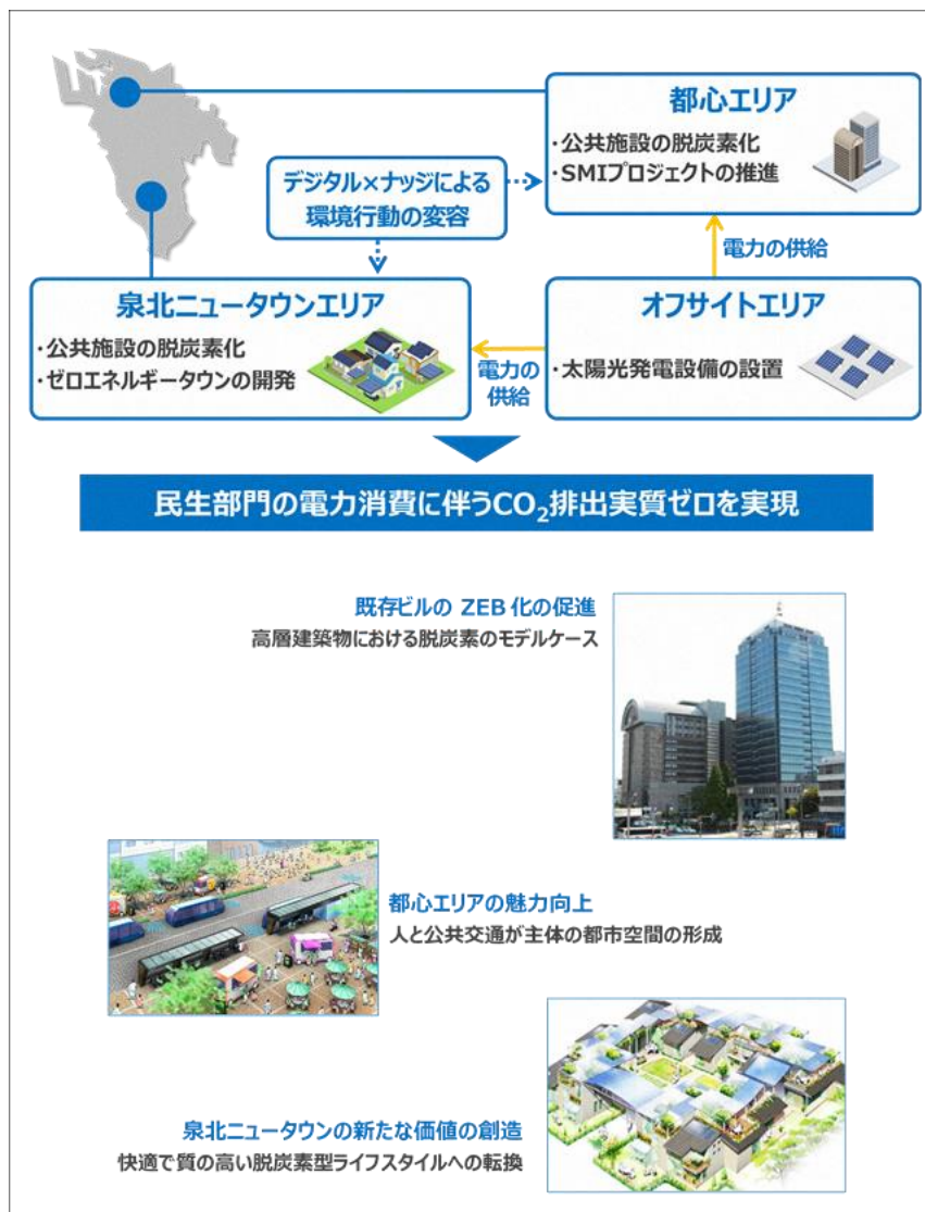
【図表3】堺エネルギー地産地消プロジェクト

加えて、堺市は令和4年に国の脱炭素先行地域に選定され、「堺エネルギー地産地消プロジェクト」を実施している。都心エリアでは、市庁舎の改修によるZEB（ネット・ゼロ・エネルギー・ビル）化や堺・モビリティ・イノベーション・プロジェクトの推進、泉北ニュータウンエリアでは、ゼロエネルギータウンの開発を推進している。また、市内各地のオフサイトエリアへ太陽光発電設備を導入し、都心エリアと泉北ニュータウンエリアに再生可能エネルギーを供給するほか、デジタル手法を活用したナッジの働きかけによる環境行動変容の促進に取り組んでいる。【図表3】