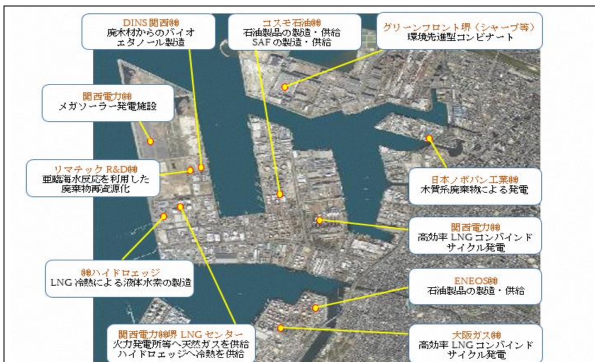
【図表 1】 臨海部における低炭素・エネルギー関連拠点

特に、次世代エネルギーとして期待されている水素については、液化水素製造の国内主要 3 拠点（堺・千葉・山口）の一角を占め、国内最大級の液化水素プラントが設置されている。