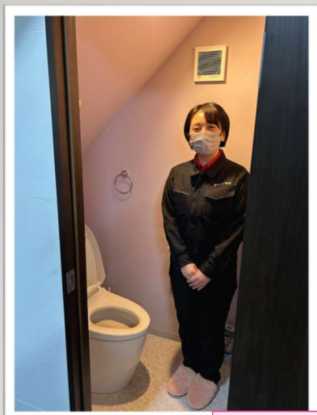
整備後 女性用トイレ 男性用トイレ