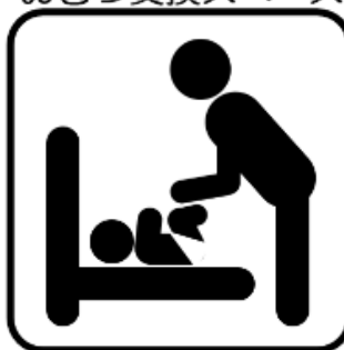
おむつ交換スペース