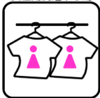
女性用洗濯干し場