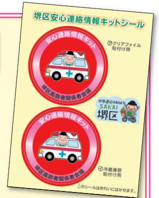
「シール2枚」 （冷蔵庫用とクリアファイル用）

ご希望の方は、堺第1～4地域包括支援センター・堺基幹型包括支援センター・堺区役所地域福祉課まで、お問い合わせください。