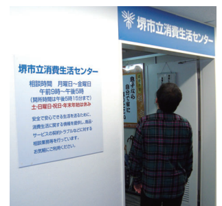
堺市立消費生活センター