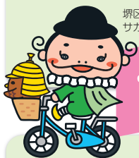
堺区マスコットキャラクター サカエル&みぞさかい

また、登録されたAEDは消防指令センターでも把握していますので、119番通報時には状況に応じて指令管制員 (オペレーター) から通報者へ情報提供を行います。