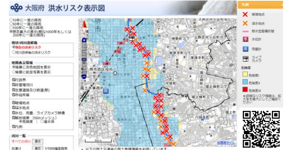
大阪府 洪水リスク表示図 (pref.osaka.jp)