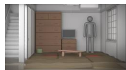
内閣府【通常版】(水害編) 警戒レベルに関する映像 - Bing video