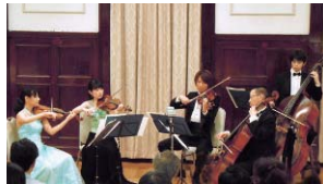
指定席。小学生以上が対象。

6月8日(土)、午後2時開演。前売券発売中。大人1,700円、高校生以下1,000円(いずれも当日券は300円増し)。全席