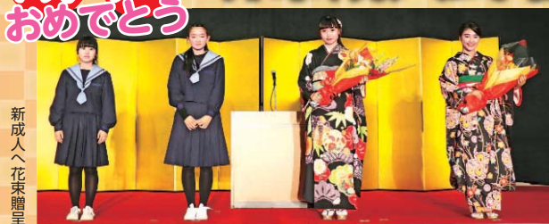
新成人へ花束贈呈

20歳になった若者の前途を祝い、1月14日(祝日)、午前10時から家原大池体育館(地図参照)大アリーナで、成人式を開催します。平成10年(1998年)4月2日~11年(1999年)4月1日生まれ