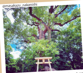
#根上がり #植上がり #大鳥大社の大楠