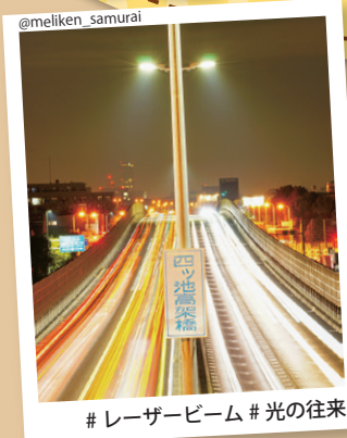
#レーザービーム #光の往来