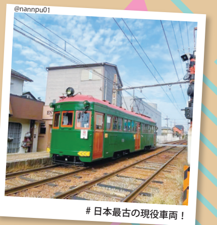
#日本最古の現役車両!