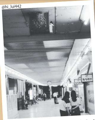
#ツバメ #ツクノ #キトリセカイ