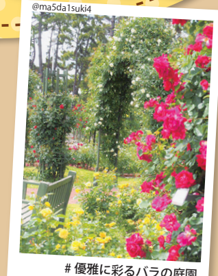
#優雅に彩るバラの庭園