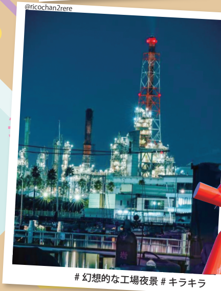
#幻想的な工場夜景 #キラキラ