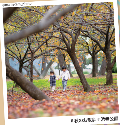
#秋のお散歩 #浜寺公園