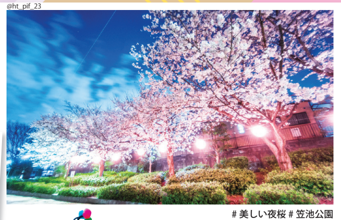
#美しい夜桜 #笠池公園