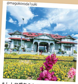
#レトロ感あふれる浜寺公園駅旧駅舎