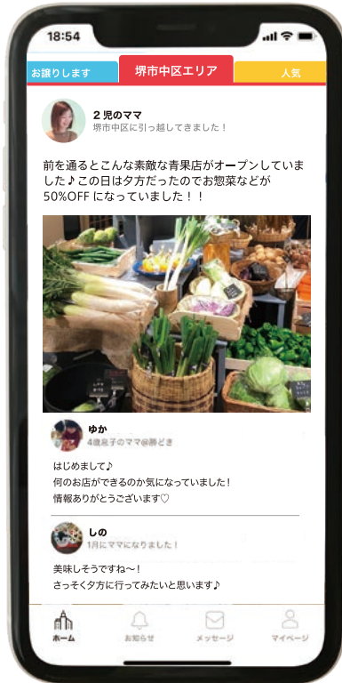
※画面はイメージです