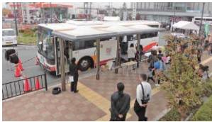
みはら区民まつりでのバスの乗り方教室

美原区域路線バス(表の4路線)は、美原区域から市内鉄道駅へアクセスしており、路線の維持のため、地域・バス事業者・行政が協力し、利用促進に取り組んでいます。その一環として、みはら区民まつりでの利用啓発活動や、美原高校と農芸高校の新入生を対象にバス通学に便利な情報を掲載したパンフレットの配布などを行っています。