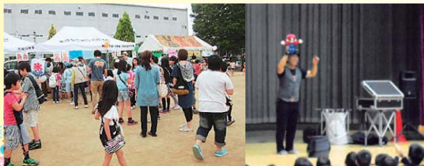
模擬店が並ぶグラウンド