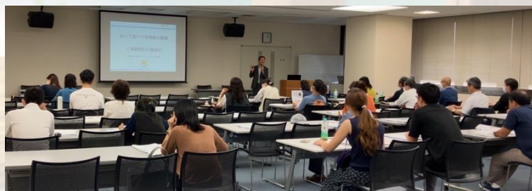
令和5年度セミナーの様子