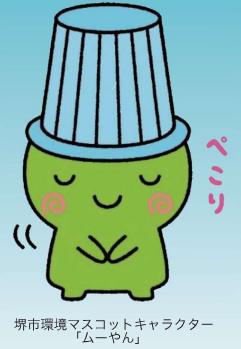
堺市環境マスコットキャラクター「ムーたん」

パソコンや携帯電話等の小型家電は貴金属やレアメタルといった有用金属をたくさん含んでおり、リサイクル可能な貴重な資源です。この貴重な資源をもっと有効に活用するため、2013年4月から小型家電リサイクル法がスタートしています。