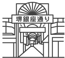
SAKAI GINZA DORI