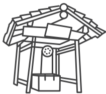
SEN NO RIKYU YASHIKI-ATO