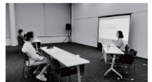
▲7月 超初級会計講座