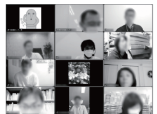
▲9月 マッチング交流会