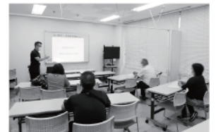
▲7月 助成金申請のコツ