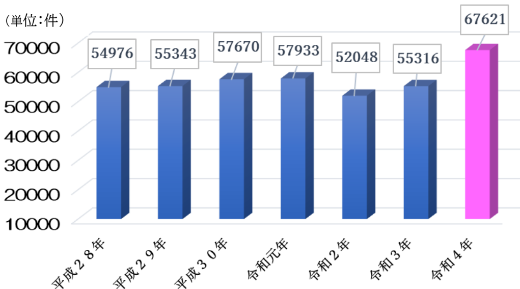
堺市消防局 救急件数の推移

東区内において発生した救急出場件数は56,599件、1日の平均出場件数は約15件で、出場件数を前年と比較すると12,059件の増加となっています。