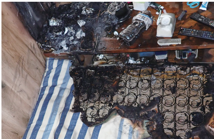
たばこ火災で燃えた布団

たばこ火災の多くは吸い殻の不始末が原因であり、適切な処理をすることでたばこ火災を防止できます。大切な命と財産をたばこによって失わないために、以下の点に留意してください。