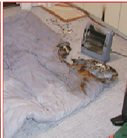
電気ストーブによる出火②