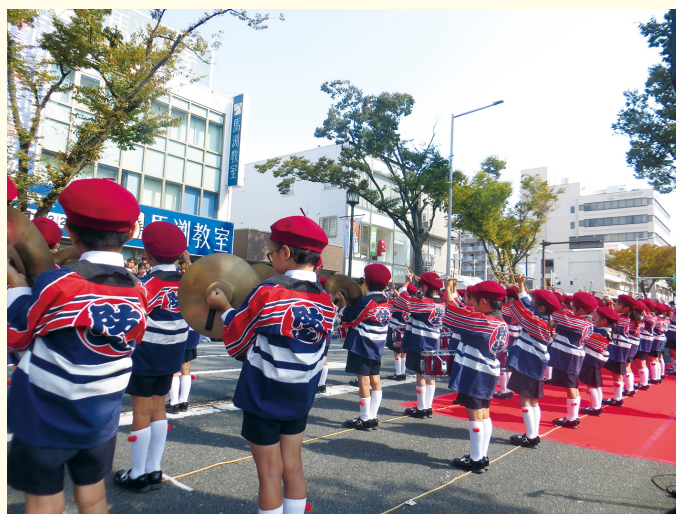
ぼうかほっぴ 防火法被姿で演奏

宝珠学園幼稚園幼年消防クラブ（堺市堺区）は、年間の活動の一環として、令和5年10月15日（日）に第50回「堺まつり」に参加しました。同クラブは、堺市立市小学校前に設営されたファミリープレイストリートで鼓隊演奏を行いました。多くの観客を前に、少し緊張した面持ちの園児達でしたが、日頃の練習の成果を大いに発揮し、堂々とした演奏を披露して、大盛況のうちに幕を下ろしました。今回の活動を通じて、堺市民をはじめとした多くの観客の防火意識の向上に大きく貢献することができました。