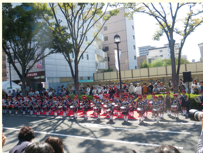
大勢の前で少し緊張