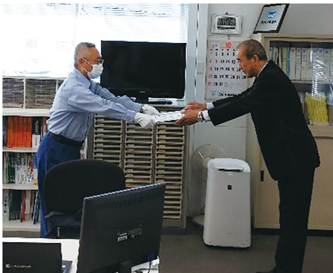
株式会社鈴木商館 堺営業所