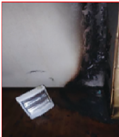
電気ストーブによる出火①