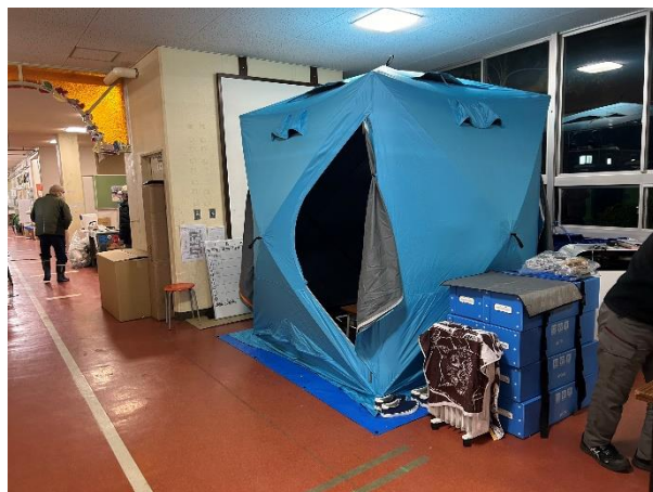
簡易シャワーの管理