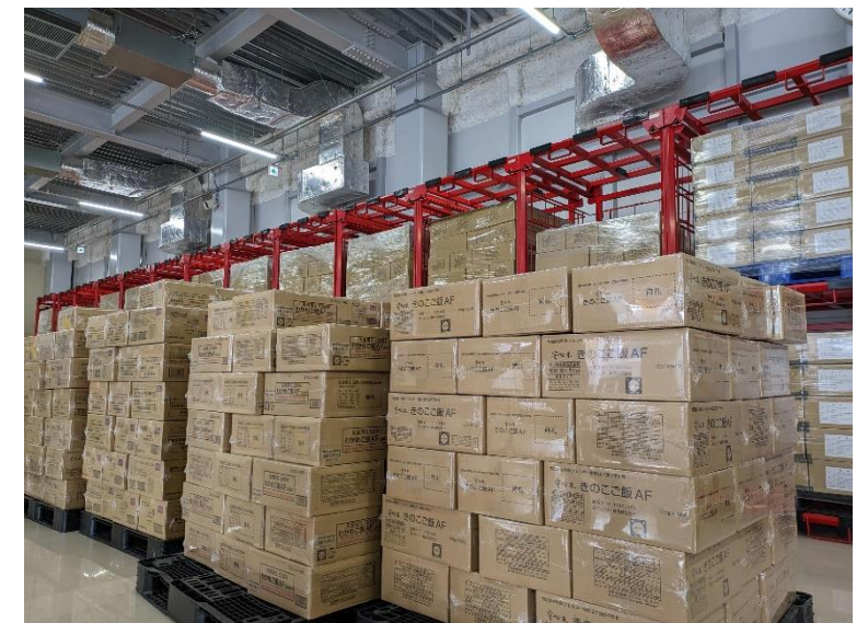
食糧（レトルわかめご飯等）