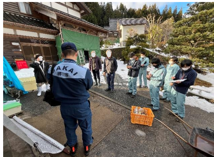
避難所運営に関する調整