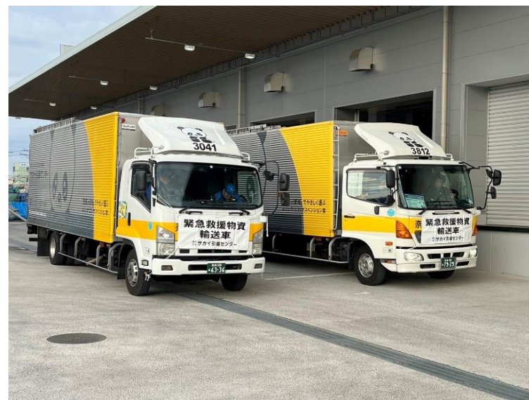
民間事業者による搬送