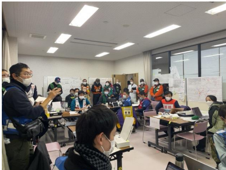
穴水保健医療調整本部会議