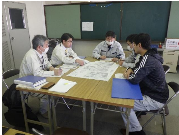
白山市担当者との 調査計画の協議状況