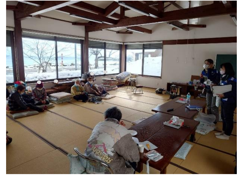
避難所での健康支援・啓発