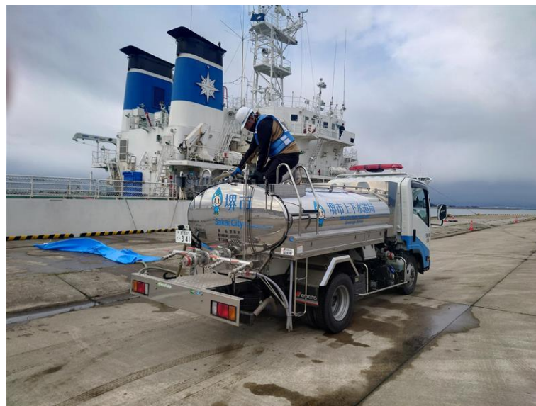
給水車への水の補給