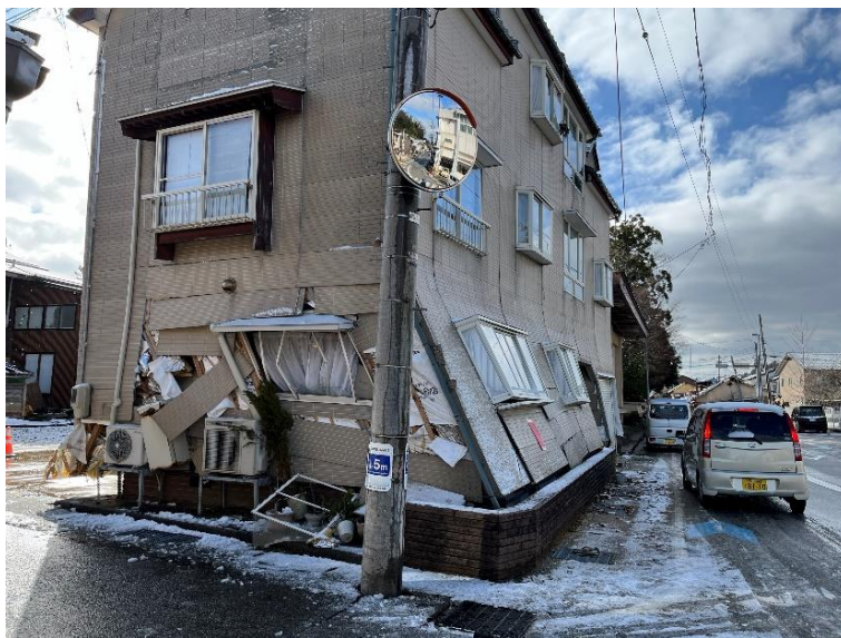
倒壊の危険性がある家屋

建築物の危険度を応急的に判定、表示〔危険（赤）、要注意（黄）、調査済（緑）〕し、住民への注意喚起を行う。