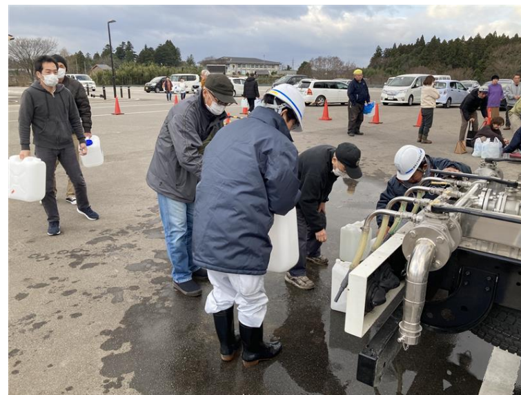
避難所での応急給水