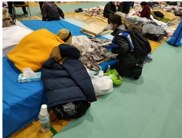
避難所での健康観察