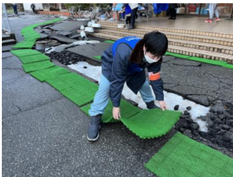
泥落としマット設置