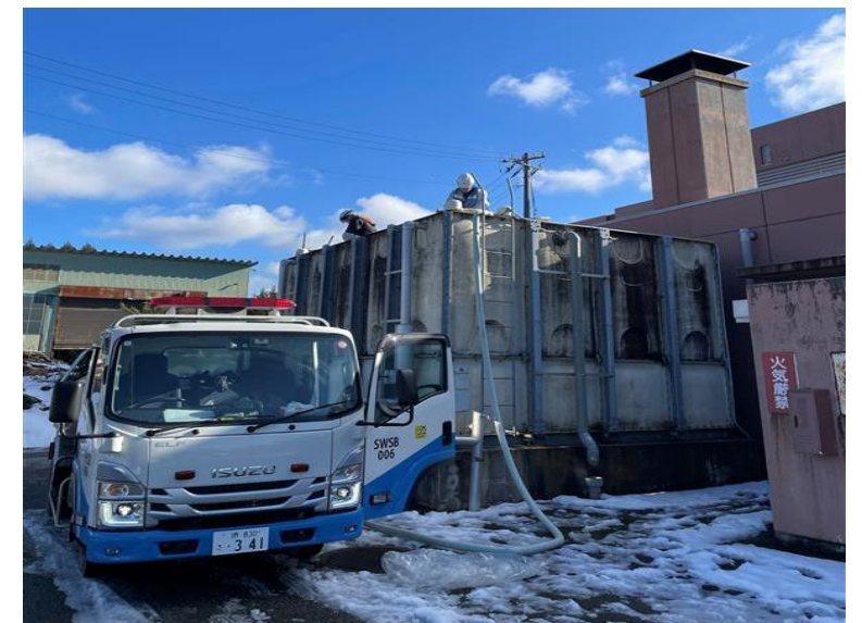
福祉施設への応急給水