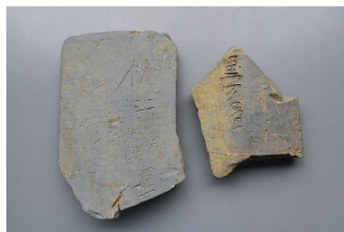
◀出土瓦(会場に展示します)▶

※駐車場は30分無料です。混み合うことがありますので、できるだけ公共交通機関をご利用ください。