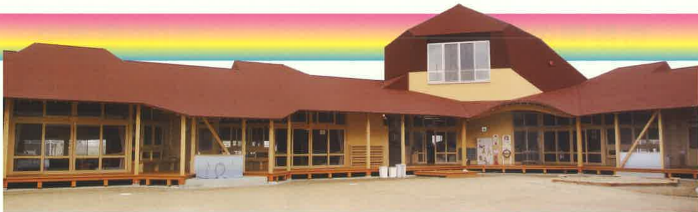
平成25年2月に新しい園舎が出来ました。木造平屋建てのシュタイナー建築です。