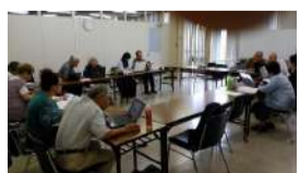
講習会状況マンツーマンで指導風景