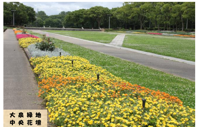
大泉緑地 中央花壇