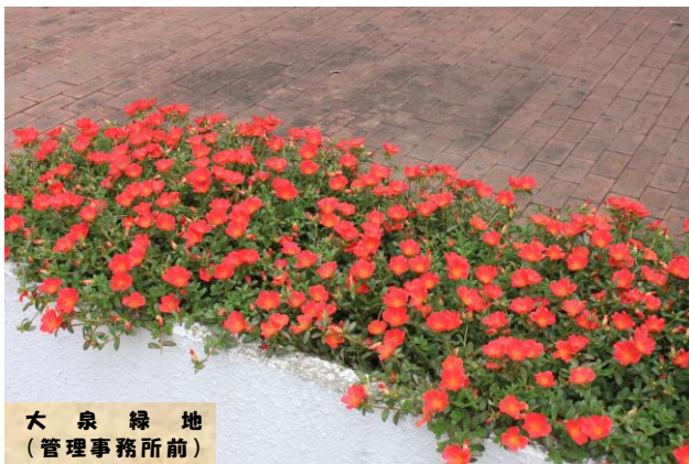
大泉緑地 (管理事務所前)