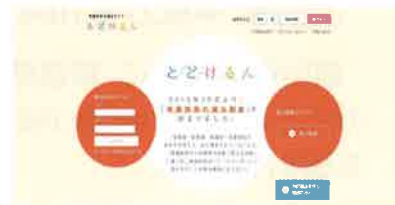
「とどけるん」のトップページ