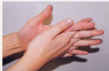
4. 指の間を十分に洗う