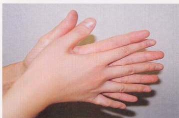
1. 手のひらを合わせ、よく洗う