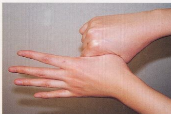
5. 親指と手掌をねじり洗いする