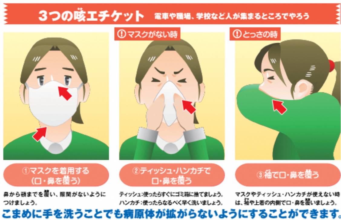
図3 咳エチケットについて