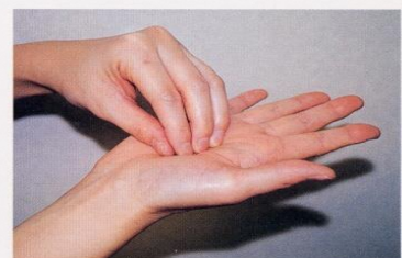
3. 指先、爪の間をよく洗う