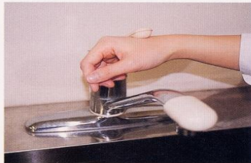
7. 水道の栓を止めるときは、手首か肘で止める。できないときは、ペーパータオルを使用して止める