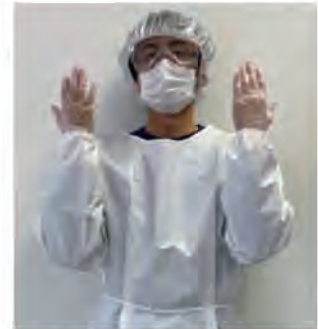
個人防護具の着用

感染しているかどうかにかかわらず、血液や体液、分泌物、嘔吐物、排泄物等を扱う場合、またはこれらに触れる可能性がある場合は手袋を着用しましょう。これらが飛び散る可能性がある場合、例えば 咳がある場合や喀痰吸引を行う場合、利用者に直接的な他害（噛みつき、叩く、頭突き等）行為等の可能性がある場合 などは、エプロン・ガウン、ゴーグル・フェイスシールド、キャップ等も着用しましょう。利用者の状態や特性、ケアの方法などの状況に応じて適切に防護具を選択し、組み合わせて使用します。