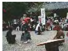
上神谷のおどり (国記録選択)