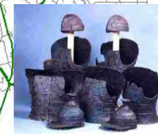
黒姫山古墳出土 甲冑類(市指)