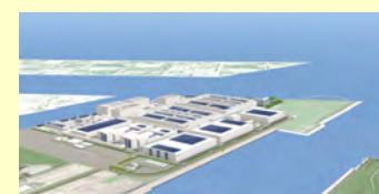
グリーンフロント堺 (2009年10月稼働)