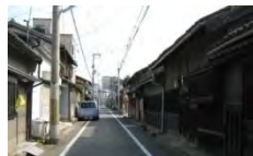
環濠内のまちなみ