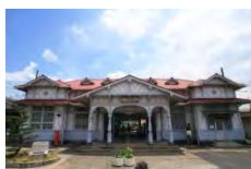
浜寺公園駅舎(登録)