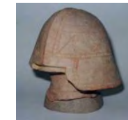
衝角付冑型埴輪(市指)