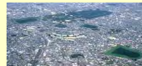
百舌鳥古墳群 (47基(4km四方))