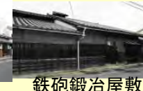
鉄砲鍛冶屋敷 (日本唯一現存)