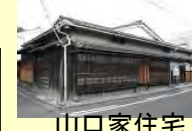
山口家住宅 (江戸時代前期)