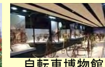
自転車博物館 (日本唯一)