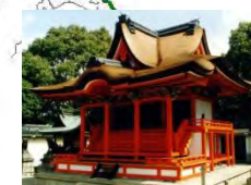
多治速比売神社(重文)