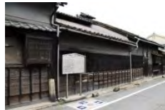
鉄砲鍛冶屋敷(市指)