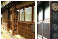
伝統産業 刃物・線香