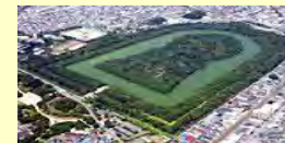
仁徳天皇陵古墳 (墳長486m)