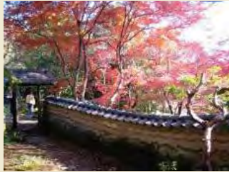
老櫓荘からみた紅葉

板橋地区周辺には、小田原北条氏の時代から続く社寺群や近代に相次いで建てられた政財界人たちの別邸などが良好なまちなみの中に残り、そこでは古くから庶民に信仰されてきた宗教行事や民俗行事が今も行われています。