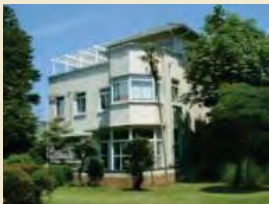
小田原文学館本館

国登録有形文化財である小田原文学館（本館・別館）の修繕を実施し、周辺の歩行者空間の整備等とあわせて、まちなかを回遊する際の休憩施設としての機能を付加する整備を行います。