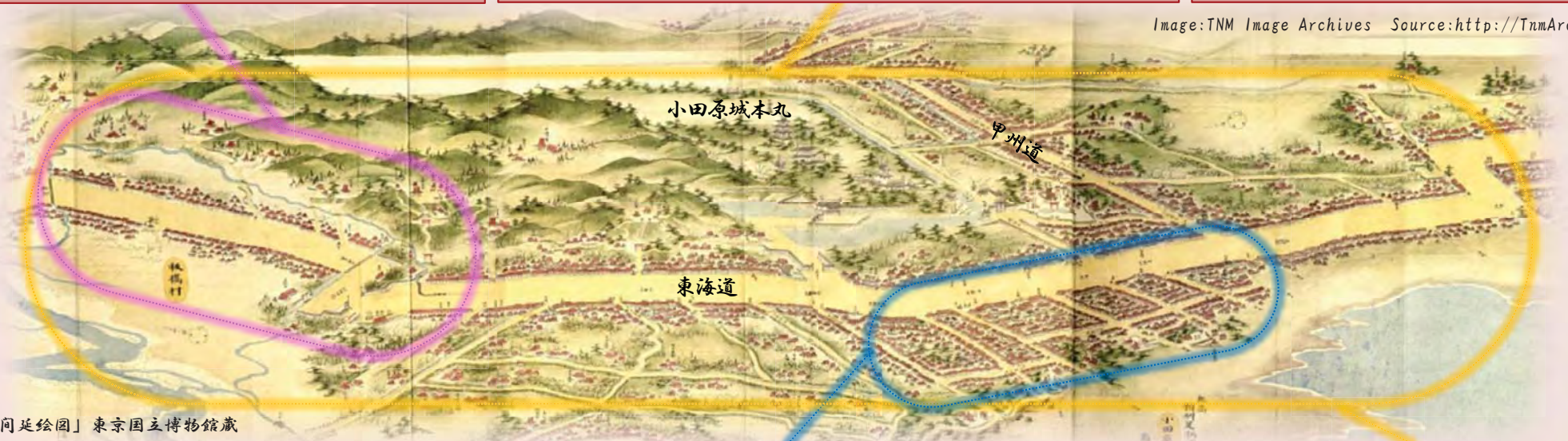
「東海道分間延絵図」東京国立博物館蔵