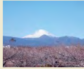
曾我梅林と富士山

伝統的な梅の栽培が行われる曾我梅林を中心とした地域は、梅の木々や梅香、梅干製造などの農家の営みとが一体となって独特な景観を形成しています。