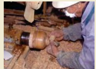
小田原漆器製造の様子

小田原漆器をはじめとする伝統工芸は、それぞれの歴史と伝統を受け継ぎながら現在も行われ、小田原に住む人々の生活などと一体となって良好な環境を形成しています。