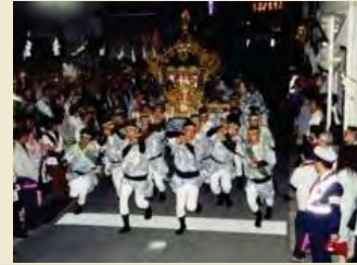
松原神社神輿の宮入

旧くは三大明神と称された松原神社、居神社、大稲荷神社で行われる例大祭では、それぞれの歴史と伝統を受け継いだ神輿を担ぐ氏子たちの勇壮な姿や木遣りの甚句、お雛子の笛の音などが今も賑やかに行われ、周辺の地域と一体となって良好な環境を形成しています。