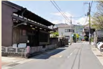
板橋地区周辺 のまちなみ