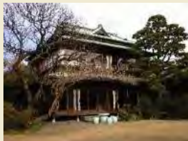
小田原文学館別館 (白秋童謡館)