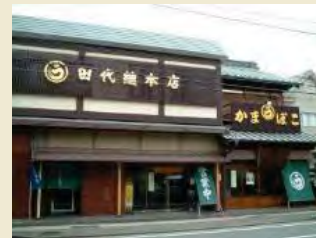
出桁造りの伝統的商家

東海道屈指の宿場町であった小田原の台所を担った千度小路周辺には、蒲鉾や削り節、干物などの製造・販売を行う伝統的な商家やそれらの店舗が多く集積するかまぼこ通りと呼ばれる通りなどがあり、そこで行われる歴史と伝統を今に受け継ぐなりわいと一体となって良好な環境を形成しています。