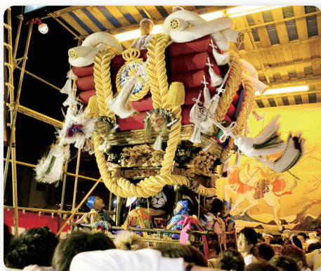
はっさく 開口神社の八朔祭で奉納されるふとん太鼓