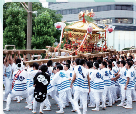
みこしときよ 住吉祭神輿渡御

◆日時 2021年 10月30日(土) 13:30~17:00 (開場13:00)