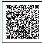
電子申請システム 二次元コード