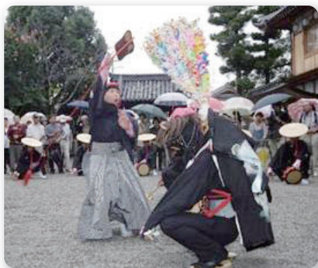
にわだに 上神谷のこおどり (国選択・大阪府指定無形民俗文化財)

堺の無形文化遺産に焦点をあて、わたしたち堺市民にとって身近な無形文化遺産を守り伝えることへの理解の促進と無形文化遺産の保護と継承の重要性について考えます。