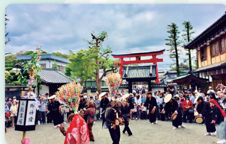
櫻井神社での奉納