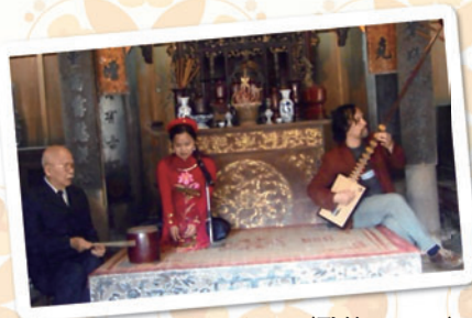
カーチュー (歌籌・Ca trù)