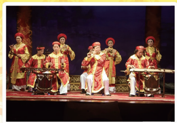
フエ宮廷雅楽 (Nhã nhạc cung đình Huế)