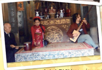
水上人形劇 (Múa rối nước)

ベトナムの旧正月「テト(2月16日)」の前に、甘いベトナムコーヒーを飲みながら、堺市と歴史的に深い関係のあるベトナムの無形文化遺産のお話を聞きましょう。