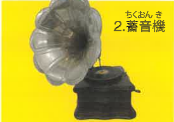
ちくおんき 2. 蓄音機