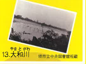
13. やまとがわ 大和川