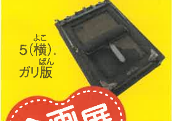
よこ 5(横). ぼん ガリ版