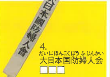
4. だいにほんこくぼう ふじんかい 大日本国防婦人会