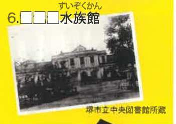
6. すいぞくかん 水族館