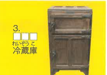
3. れいぞうこ 冷蔵庫