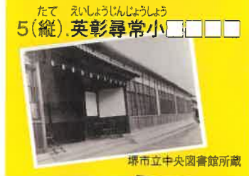
たて えいしょうじんじょうしょう 5(縦). 英彰尋常小