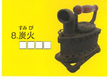
すみび 8. 炭火