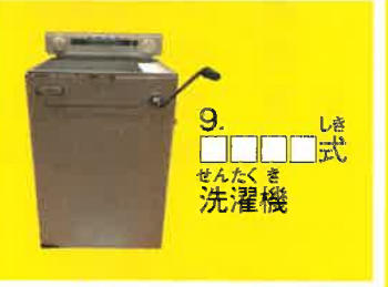
9. せんたくき 洗濯機