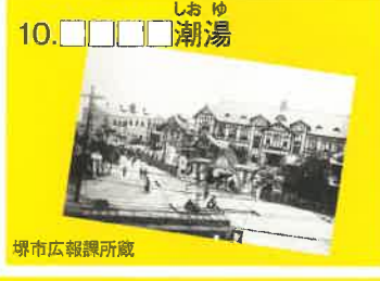
10. しお ゆ 潮湯