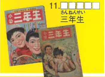
11. さんねんせい 三年生