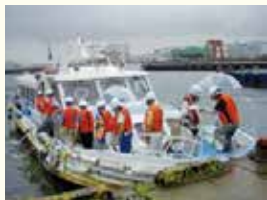
最終処分地見学の様子