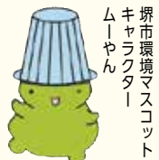
堺市環境マスコットムーヤン

【申込】はがきかFAX、電子メール(1通4人まで)で参加者全員の郵便番号、住所、氏名、電話番号、年齢、参加日を書いて、9月30日(必着)までに資源循環推進課(〒590-0078 堺区南瓦町3-1 ☎228-7479 FAX228-7063 shijyun@city.sakailg.jp)へ。抽選40人。